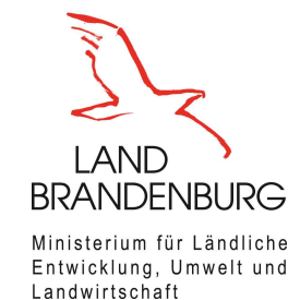
Groß Kreutzer Schaftag 2018