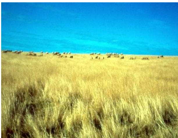
Groß Kreutzer Schaftag 2018

Groß Kreutzer Schaftag 2018 nach Groß Kreutz (Havel) ein.