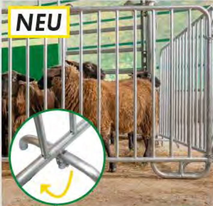
2-in-1 Absperrgitter Duofix mit drehbaren Kufen