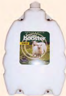
■ Super Booster Vitaminsdrench für Lämmer und Leistungsschafe