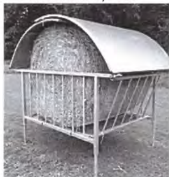
Rundballenraufe mit Dach für Ballen bis 1,65m