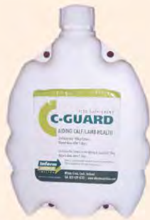
■ C-Guard Kokzidienbekämpfung