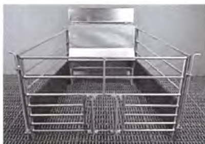
Futterautomat für Lämmer mit Schlupf