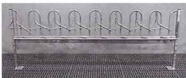
Fang.-Fressgitter für Ziegen & Schafe

auch als Melkstand mit Kaskadenprinzip Fertigung per laufender Meter nach ihren Wünschen individuell bei Tierabstand und Halsweite