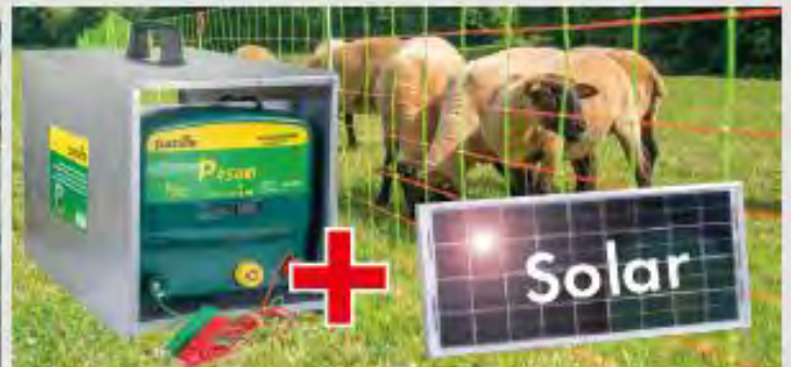
Elektrozäungeräte / Herdenschutznetze