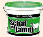
■ Merino creme- produkte bei trockener und beanspruchter Haut, Wirkstoff Lanolin