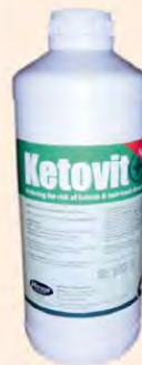
■ Ketovit für festliegende Schafe